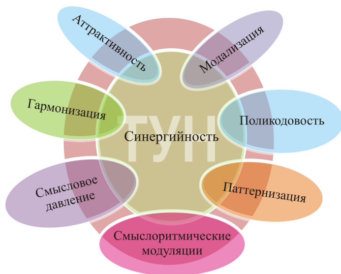
Рис. 1. Модель ТУН

Аттрактивность дискурса позволяет притягивать и перенаправить внимание и интерес адресата, активизируя его интеллект. Гармонизация способна усилить пенетрационную способность заложенных в сообщение паттернов посредством гармоничного структурирования дискурса по принципу золотого сечения. Паттернизация регулируема и может меняться – ослабляться или усиливаться по ходу высказывания для обеспечения лучшей встраиваемости дискурса в сознание адресата посредством разделения дискурса на дискурсивно-смысловые паттерны. Использование смыслоритмических модуляций способствует более глубокой пенетрации паттернов без сознательного осмысления и сопротивления адресата. Модализация дискурса стимулирует относиться к объекту дискурса с заданной идеологической позиции, эмоционально настраивая на определенное восприятие и возможное сопереживание. Поликодовость способствует усилению воздействующего потенциала разных семиотических кодов на управление коммуникацией. Тенсивность дискурса становится основанием для различных трансформаций, интенсификаций и смещения смысла в когнитивно-коммуникативном пространстве.