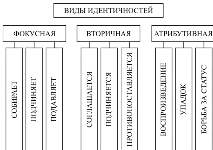
Рис. 2. Виды и направленность идентичностей

Типологически можно выделить три вида идентичностей, исходя из общей роли в системе (рис. 2): фокусные, вторичные, атрибутивные.