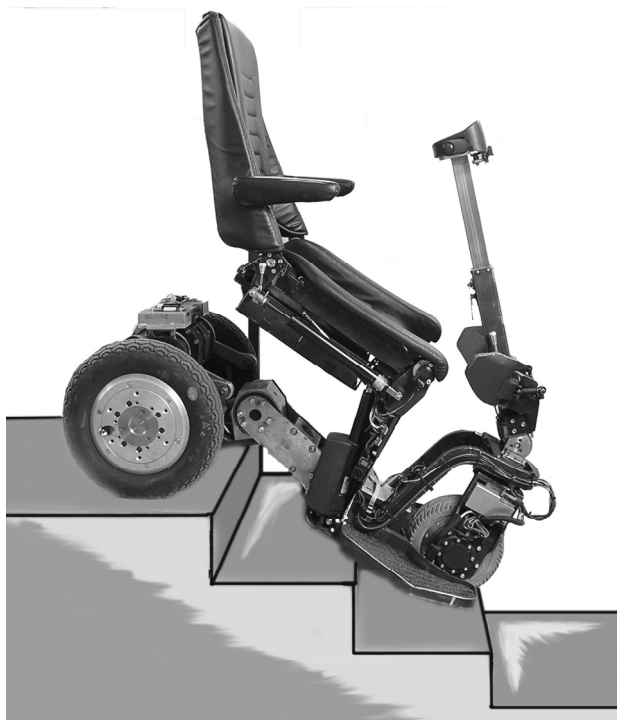
Рис. 1. Экспериментальный образец транскутера семейства «Кенгуру» ( Kangaroo ) на спуске с лестницы

Разработчики (и упомянутая Лаборатория электродвижения) «выдают на гора» порой весьма совершенные, оригинальные, даже «экзотические» проекты, научно-техническая ценность которых сохраняется даже в случаях их недоведения до внедрения.