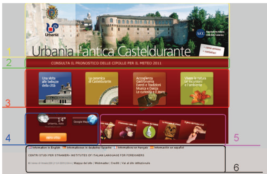
Рис. 1. Главная страница сайта о городе Урбания

Название второй визитной карточки – «Урбания античный Кастельдуранте» ( Urbania l'antica Casteldurante ) (рис. 1).