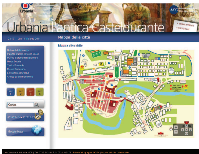
Рис. 3. Интерактивная карта города

В заключение хочется отметить, что содержательность и привлекательность оформления городских сайтов обеспечивает хорошие показатели статистики по востребованности интер-