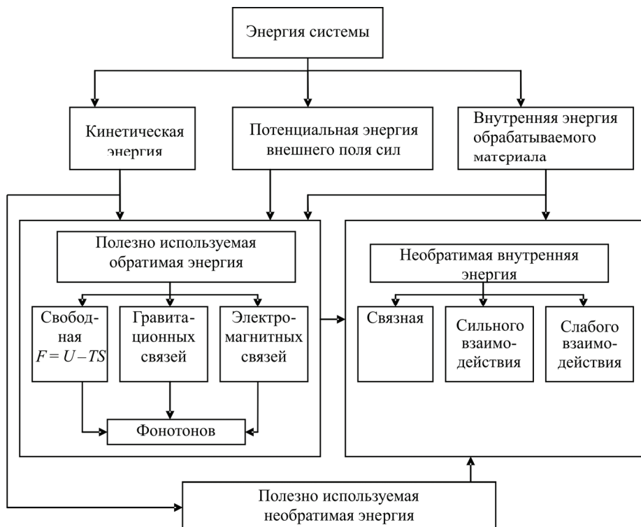
Рис. 2. Структурная схема энергетической системы КАММ «машина – обрабатываемый материал»

Энергия КАММ разделяется на две характерные группы. Первые два блока содержат потоки энергии, которые принимают непосредственное участие в обработке материалов. В нее входят внутренняя, полезно используемая обратимая энергия, не зависящая от движения всей системы или присутствия внешних силовых полей, а также свободная, гравитационная и электромагнитная энергии связей. Полезно нагружает материал и внешняя необратимая энергия. Их проявления во внутренних процессах снижают напряжения разрыва. Правильное использование этих потоков улучшает показатели производственных граничных условий. Другой блок содержит связанную энергию, энергии сильных и слабых взаимодействий, способствующих росту сопротивления разрыву. В гуконской модели эти положения не учитываются, они же не принимаются во внимание при расчете и проектировании машин. Если точно известно микроскопическое состояние системы «машина – обрабатываемый материал» в фиксированный момент времени, то с использованием законов механики можно вычислить его положение в любой момент времени. Для описания базисной системы следует определить единый интегральный показатель, характеризующий систему в целом и каждый структурный эле-