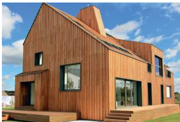
Рис. 6. Коттедж стоимостью 38 млн руб.

В соответствии с этой программой в нашей стране уже реализовано несколько таких проектов. Одним из первых энергоэффективных проектов в России считается жилой дом в микрорайоне Никулино-2 в Москве. Этот дом приносит своим жителям экономию в 2 млн руб. в год по ценам 2010 г. Осенью 2011 г. был построен уникальный «зеленый» дом (рис. 6), который снабжен солнечным коллектором, геотермальным насосом, системой рекуперации тепла и системой «умный дом», контролирующей все показатели вплоть до содержания углекислого газа в воздухе. Предполагалось, что дом будет тратить электроэнергию на 12 тыс. руб. в год. Но в реальности стоимость дома составила 38 млн руб., поэтому он представляет собой скорее музейный экспонат, чем коммерческий проект, так как очевидно, что от него никогда не будет получено прибыли.