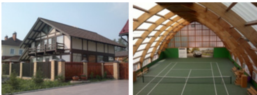
Рис. 8. Энергосберегающий дом и крытый теннисный корт (г. Пермь)

нисный корт выполнен в виде арочной конструкции с применением клееной конструкционной балки и светопропускающей панели RODECA, позволяющей на 40–50 % снизить затраты на отопление. Также возводится ряд жилых домов из заводских клееных панелей с применением энергосберегающих технологий в микрорайоне Ива-1.