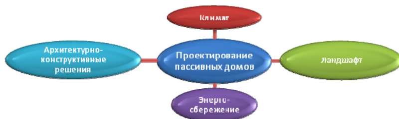
Рис. 1. Факторы, влияющие на проектирование нулевого дома

Здание нулевого типа – это сложнейший синтез большинства строительных направлений, дополняемый техническими разработками (рис. 1).