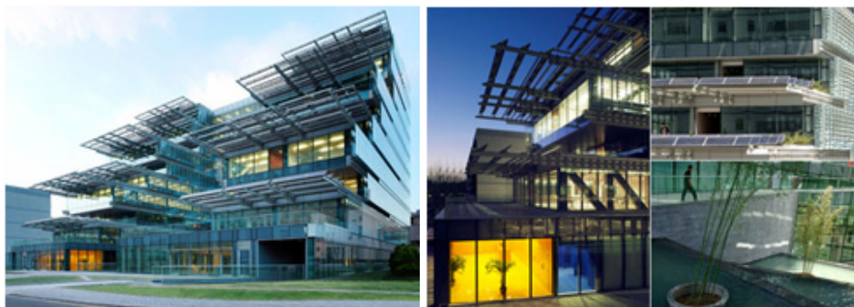
Рис. 3. Университет Синьхуа (Пекин)

Еще одним ярким примером нулевого дома в КНР является здание университета Синьхуа, построенное в Пекине (рис. 3). Оно спланировано так, чтобы максимально сократить расходы на охлаждение и обогрев строения. Крыша-козырек с установленными здесь солнечными батареями выполняет двойную функцию: в жаркую солнечную погоду создает тень, одновременно с этим вырабатывая электричество.