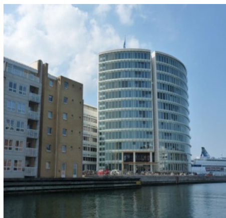
Рис. 5. Энергоэффективный квартал Мальмо (Швеция)

«Питаться» здания будут солнечной энергией, преобразуемой с помощью установленных солнечных батарей. Кроме того, снаружи стены будут оборудованы таким образом, что все тепло, которое они смогут накопить за день, будет обогревать здание в ночные часы.