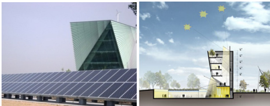
Рис. 2. Центр энергетических технологий (Китай)

Специальная архитектура здания позволяет правильно распределить воздушные и световые потоки, которые зависят от положения и высоты светила над горизонтом, что ведет к сокращению потребностей в искусственном освещении и направляет воздушные потоки [5].