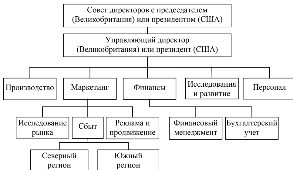
Рис. 2. Описание структуры компании

Поскольку ориентировочно-референтное чтение ставит задачу общей ориентации в тематике вновь поступивших, ранее не изученных текстовых материалов, чтобы разобраться, по каким проблемам, темам профессиональной деятельности на фирме поступил этот материал, то читающий определяет главную тему и основные подчиненные микротемы. При обобщающе-референтном чтении становится необходимо совершать речевое действие операционального характера выделения всех подтем или микротем, чтобы подробно представить в виде схемы о чем текст (рис. 2).