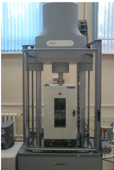
Рис. 1. Общий вид электродинамической испытательной системы Instron ElectroPuls E10000

Для проведения экспериментальных исследований динамических механических свойств на базе Центра экспериментальной механики Пермского национального исследовательского политехнического университета используется электродинамическая испытательная система Instron ElectroPuls E10000 (рис. 1).