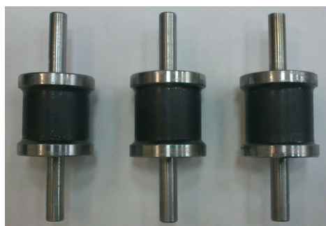
Рис. 2. Общий вид образцов для динамических испытаний

На данной установке можно проводить динамические испытания на растяжение-сжатие, кручение, а также на растяжение-сжатие и кручение одновременно. Комплектация также включает в себя температурную камеру Instron 3119, благодаря которой можно проводить испытания при различных температурах в диапазоне от -60^{\circ}\text{C} до +250^{\circ}\text{C} .