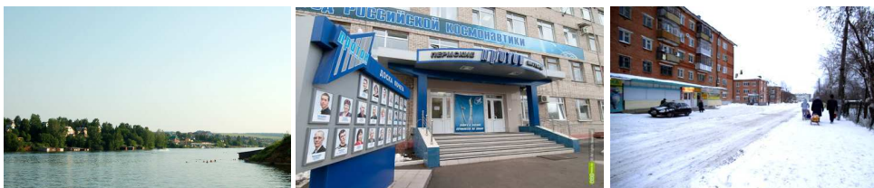
Рис. 3. Привлекательные стороны поселка Новые Ляды по мнению его жителей