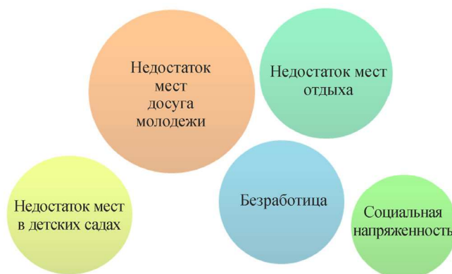
Рис. 4. Социальные проблемы поселка Новые Ляды на текущий момент

Важно также было выявление проблем территории, сдерживающих ее рост и понижающих качество жизни [2]. В отношении Новых Лядов среди текущих социальных проблем поселка, наиболее критичными оказались проблемы недостатка мест досуга для молодежи и мест отдыха для всех слоев населения поселка, что подтверждают ранее полученные ответы о причине желаяния переезда из поселка (рис. 4). Очевидно, что проблема досуга – одно из наиболее слабых мест поселка и ее необходимо решать при проектировании будущих центров активности поселка. Третье место в рейтинге проблем заняла безработица, четвертое – недостаток мест в детских садах, социальная напряженность оказалась лишь на пятом месте, что говорит об относительном спокойствии поселка.