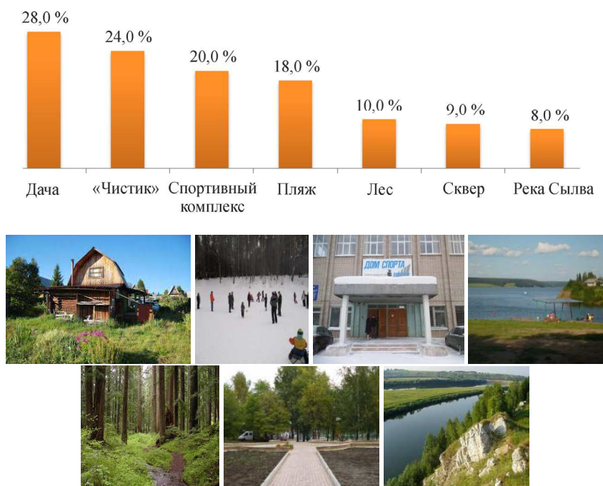
Рис. 5. Любимые места отдыха жителей поселка Новые Ляды

Остальные места отдыха, наиболее привлекательные для жителей (сосновый бор, спортивный комплекс, пляж и др.), можно определить как точки роста рекреационного потенциала поселка и предусмотреть меры по их развитию (рис. 5).