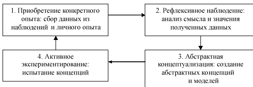
Рис. 1. Этапы цикла обучения взрослых по Д. Колбу

Перечисленные закономерности и принципы находят отражение в андрагогической модели обучения американских исследователей Д. Колба и Р. Фрая. Авторы разработали модель непрерывного обучения взрослых, охарактеризовав цикл обучения, состоящий из четырех этапов. Каждый пройденный цикл является началом следующего (рис. 1).