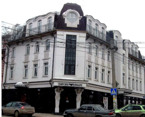
Фото 3. Здание на углу ул. Пермской и Газеты «Звезда»