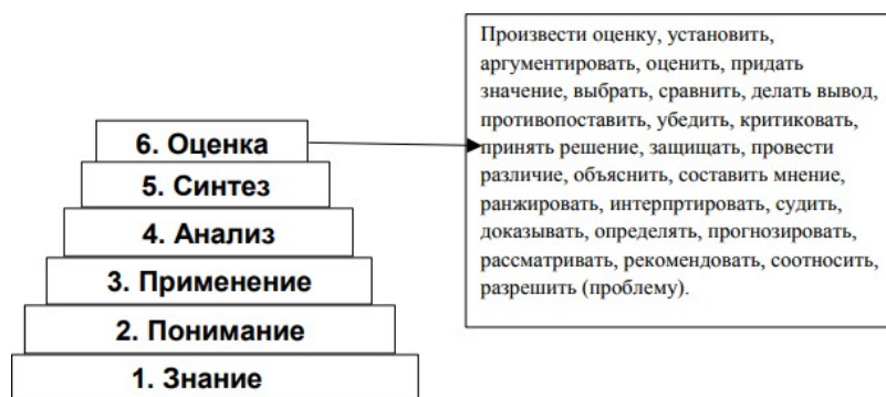
Рис. 4. Адаптация таксономии Блума

– уровни формирования результатов обучения фиксировать по таксономии Блума, от знания до оценки (таксономию Блума использовать не только для перечня глаголов формулировок результатов обучения, но для причинно-следственных уровней формирования результатов обучения) (как представлено на рис. 4).