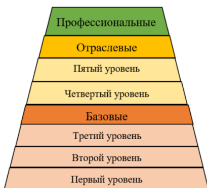
Рис. 2. Структура модели компетентности специалиста в области информационной безопасности [16]