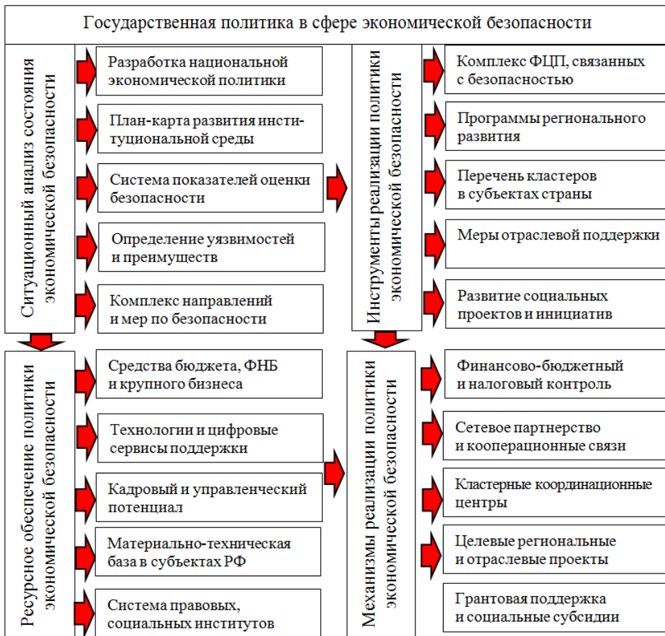
Рис. 2. Системный подход к реализации государственной политики, направленной на обеспечение безопасности личности

реализуя правовые, политические, социальные, экономические и культурно-просветительские меры.