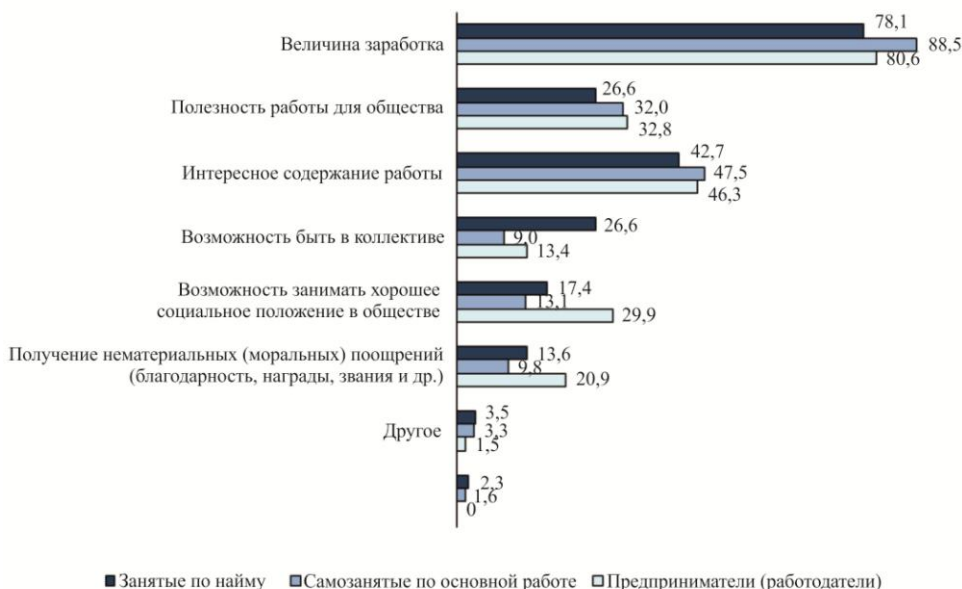
Рис. 2. Трудовые ценности в разных группах занятого населения (в процентах по каждой выделенной категории)

По данным другого исследования (Покида А.Н.) выяснились основные ценностные ориентации самозанятых в сравнении с ценностями предпринимателей и занятых по найму (рис. 2) [6, с. 33–35].