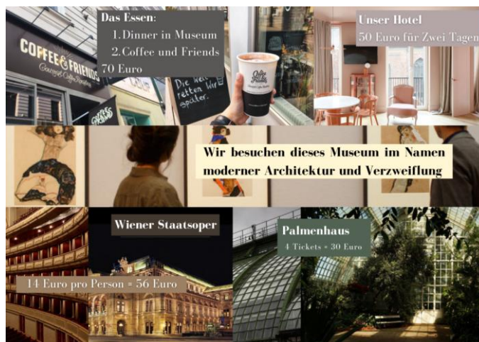
Рис. 2. Мудборд «Wien»