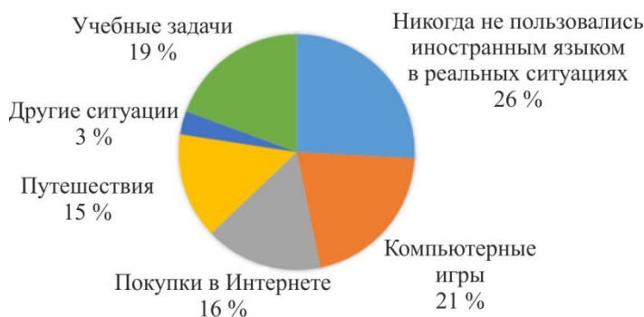
Рис. 1. Использование иностранного языка обучающимися основной школы в реальных ситуациях (составлено автором)

Первый этап исследования включал в себя выявление наиболее часто встречающихся тем и реальных жизненных ситуаций, в которых обучающимся приходилось пользоваться иностранным языком. В анкетировании приняли участие 122 обучающихся. Выяснилось, что в реальной жизни, наибольший процент обучающихся данной возрастной категории встречается с необходимостью использовать иностранный язык во время онлайн-чата компьютерных игр с игроками из других стран или для общения в социальных сетях. Многие обучающиеся пользовались иностранным языком для поиска необходимой информации в образовательных целях. Большая доля обучающихся пыталась приобрести товары на таких интернет-ресурсах, как Aliexpress.com или Alibaba.com. Часть опрошенных ездила с родителями в такие страны, как Турция, Индия, Тайланд, Израиль, Тунис, Испания, где была необходимость в общении на иностранном языке в отеле, аэропорту, магазинах или кафе. Небольшая часть опрошенных отметила другие разные ситуации. Данная статистика выглядит следующим образом (рис. 1).