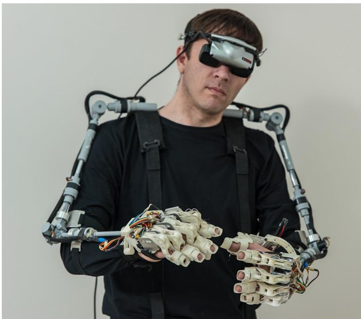
Рис. 1. Костюм копирующего типа с обратной силомоментной связью «Аватар» [15]

возникающую при обучении заданной кинематике двигательного действия: при попытках повторить какое-либо двигательное действие по показу или рассказу тренера спортсмен либо может не справиться с новой для себя нагрузкой, либо достигнутые положения звеньев могут выйти за пределы прочности биологических тканей (что в результате приведёт к получению травм). Данная проблема в спортивном экзоскелете решается за счёт предварительно заданного анатомического (свойственного конкретному индивиду) диапазона движения в каждом отдельном суставе – ROM (Range of Motion) аналогично процедуре, выполняемой в Biodex System [20]. Если заданная двигательная программа выходит за пределы ROM , пользователь получит уведомление до её реализации (с предложением внесения соответствующих корректив), а во время работы тренера в костюме задающего типа он получит по обратной связи информацию о достижении анатомических пределов при выполнении задания спортсменом.