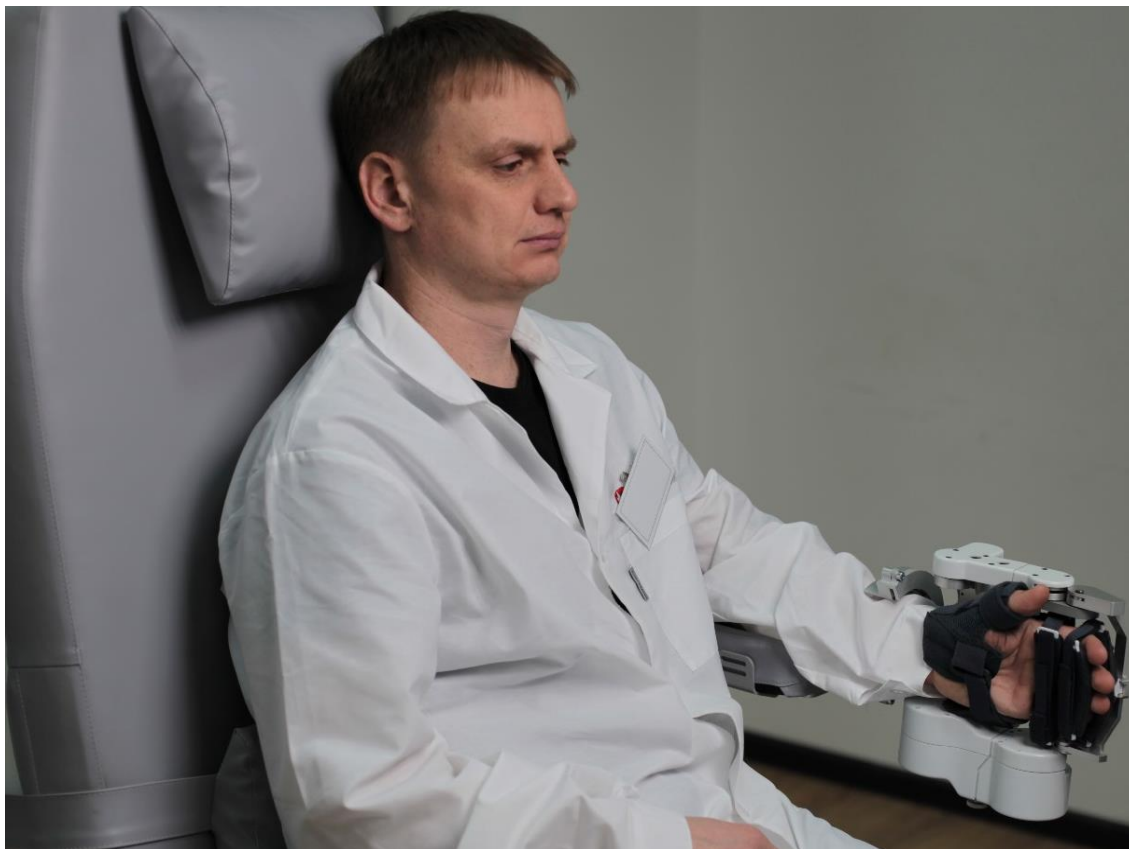
Рис. 2. Комплекс экзоскелета кисти с двумя степенями свободы (НПО «Андроидная техника» совместно с Институтом физики высоких давлений им. Л.Ф. Верещагина Российской академии наук, проект «Пианист») [15]

Доказанный клинический эффект наблюдается при применении системы экзоскелета с интерфейсом «мозг–компьютер», причём на начальных этапах реабилитации рекомендуется использовать меньшее число степеней подвижности экзоскелета с последующим их увеличением (рис. 2) [1, 16].