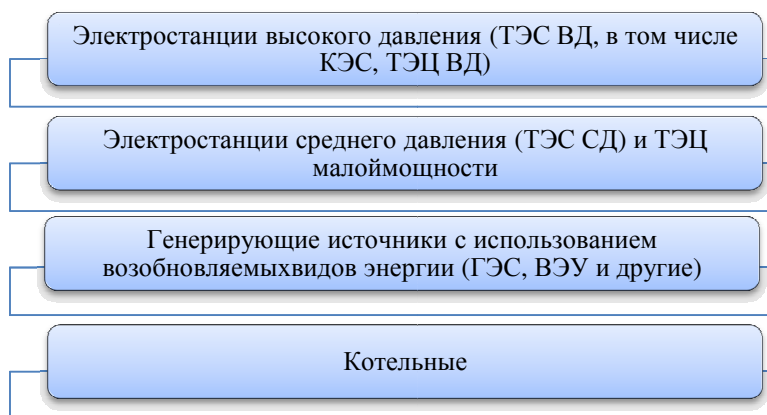
Рис. 1. Классификация объектов по производству электрической (тепловой) энергии

Раздельный учет затрат на энергетических предприятиях Республики Беларусь. Раздельный учет на энергетических предприятиях республики представляет собой систему сбора и обобщения данных о доходах, затратах и задействованных активах раздельно по каждому виду оказываемых услуг. К объектам по производству электрической (тепловой) энергии относятся все генерирующие источники, независимо от установленной мощности. Их классификация представлена на рис. 1.