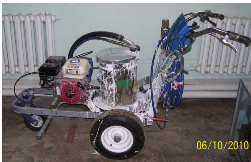
Рис. 1. Разметочная машина

Условия движения на участке нанесения разметки существенным образом влияют на скорость износа разметки, которая зависит от интенсивности движения. Так, в результате экспериментов была выведена следующая зависимость [3]: I = N^4 , где I – износ разметки; N – нагрузка на ось автомобиля.