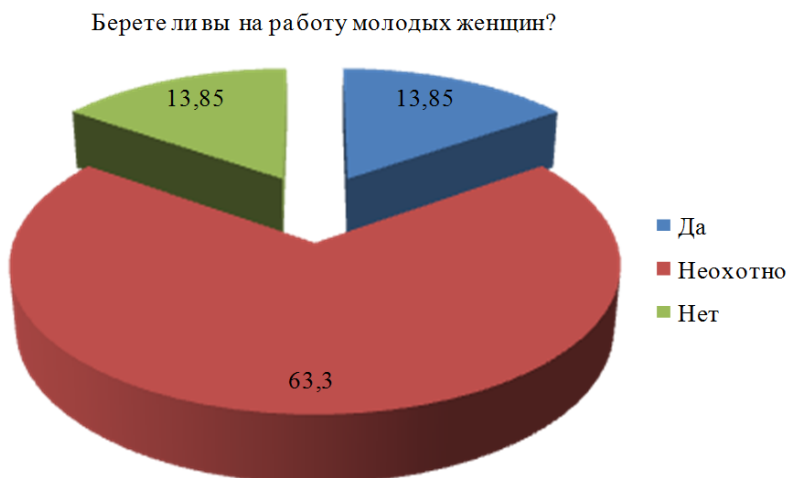
Рис. 1. Результаты социологического опроса индивидуальных предпринимателей

Социологический опрос, проведенный автором данной статьи, среди индивидуальных предпринимателей (в основном коммерческой направленности) в Лысьвенском городском округе (октябрь 2015 года), показал, что 63,3 % среди них неохотно берут на работу женщин (рис. 1). Всего было опрошено 40 представителей коммерческих организаций.