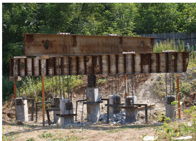
Рис. 2. Стенд для испытания свай статической нагрузкой

На первоначальном этапе на площадке строительства были выполнены динамические испытания свай, которые показали расчетный отказ S_a = 0,002...0,006 м, что свидетельствовало о достижении ими несущей способности F_u = 1140...635 кН. С учетом значительного разброса в значениях несущей способности свай, полученных по данным динамических испытаний, а также для принятия окончательного решения о возможности использования элювиальных грунтов пермских отложений в качестве основания свайных фундаментов было предложено провести статические испытания трех свай. Для проведения испытаний были разработаны три испытательных стенда. Один из испытательных стендов показан на рис. 2.