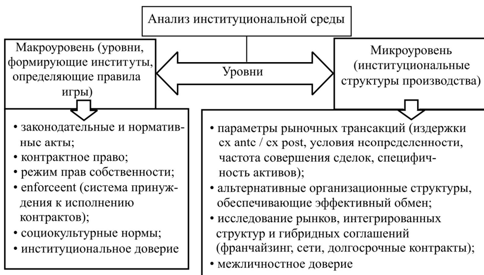
Рис. 2. Уровни анализа институциональной среды

О.В. Валиевой были выделены два уровня для проведения анализа институциональной среды (рис. 2) [1].