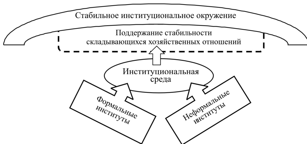
Рис. 3. Основная задача институциональной системы

Дадим наше представление основной задачи институциональной среды для формирования инновационной экономики в графической форме (рис. 3).