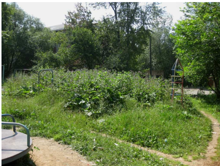
Рис. 2. Заросли репейника, полностью поглотившие элементы детской площадки

– неудовлетворительное состояние пешеходных дорожек внутри дворовой территории. Вместо покрытия нередко можно увидеть различный строительный мусор: сколоченные остатки фанеры и досок, бой кирпича, асбестоцементных листов и керамической плитки. Такое «покрытие» в первую очередь является непреодолимым препятствием для передвижении маломобильных групп населения.