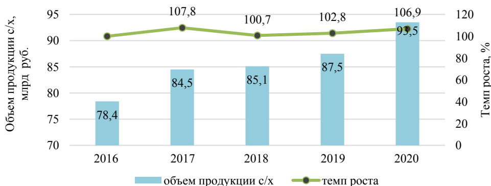
Рис. 3. Развитие рынка сельскохозяйственной продукции Брянской области за 2016–2020 гг.

Основная специализация АПК Брянской области – производство животноводческой продукции. В настоящее время из совокупного объема сельскохозяйственной продукции региона доля животноводства составляет 63,0 %, в то время как растениеводство – лишь немногим более трети (37,0 %) [21].