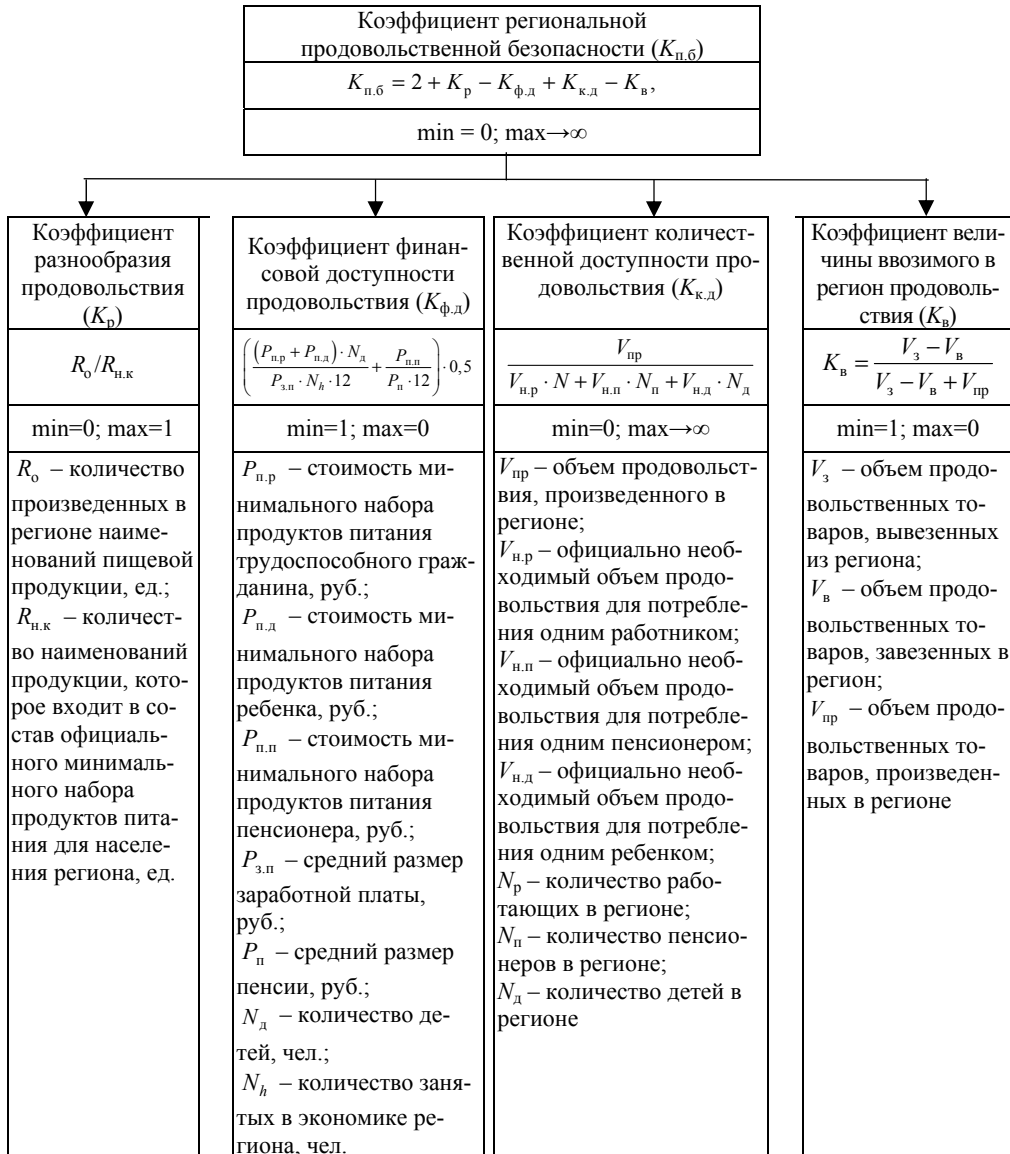
Рис. 1. Методический подход к оценке продовольственной безопасности по Ю. Терентьеву

В соответствии с авторским подходом уровень продовольственной безопасности региона определяется на основе суммирования оценок составляющих СРБП в баллах. При этом, если критерий равен 1 баллу, это высокий уровень, 2 балла – допустимый уровень, 3 балла – низкий уровень, а 4 балла – недопустимо низкий уровень продовольственной безопасности региона.